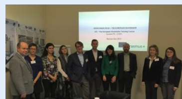
I meeting a Varsavia – 19 e 20 Novembre 2015