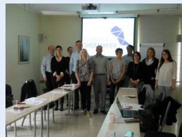
Il meeting a Milano – 21 e 22 Aprile 2016